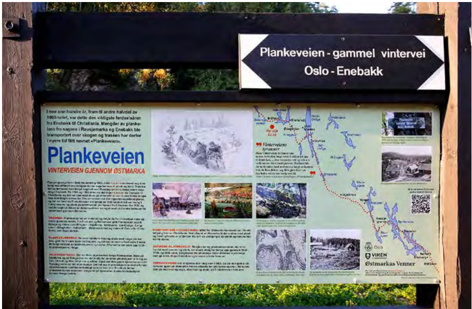
Plankeveien-prosjektet med nye skilter og informasjonstavler ble gjennomført i 2024.