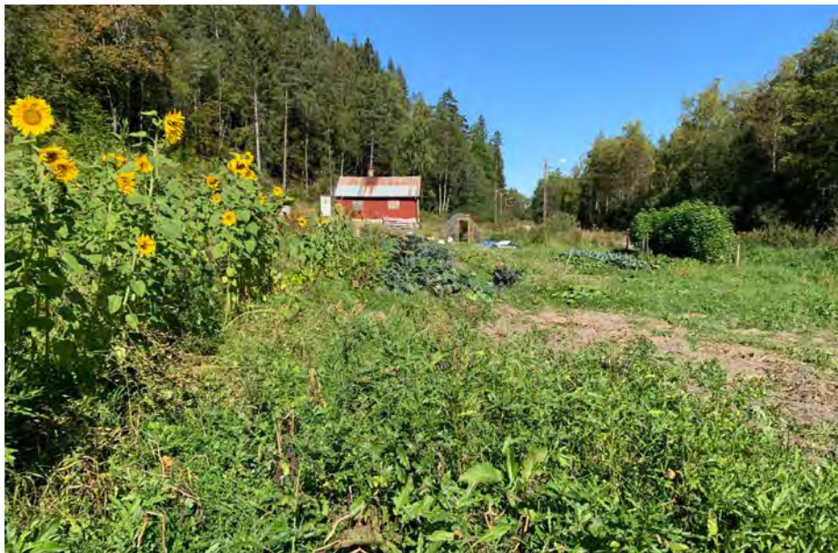
Husmannsplassen Enga i 2023.

Ved siden av den ordinære dyrkingsaktiviteten, har Enga og andelslaget hatt besøk av Oslo Elveforum, Miljøpartiet De Grønne og Klimanettverk Ellingsrud. På Åpen dag stilte Oslos ordfører Anne Lindboe opp, og hun fikk blant annet møte ungdommer fra Ellingsrud som hjalp henne med å plante kirsebærtrær. Over 200 personer besøkte arrangementet. I tillegg til uteserveringen ble det solgt grønnsaker og poteter.