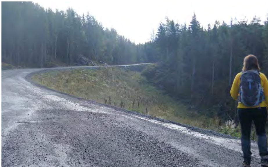
Veien opp til toppen av Marikollen slik den så ut i 2019. ØV mener at kontrollfunksjonen med reguleringsplaner må styrkes.

derfor rette vedkommende angående spørsmål om arbeider innen planområdet er i tråd med vedtatt plan.