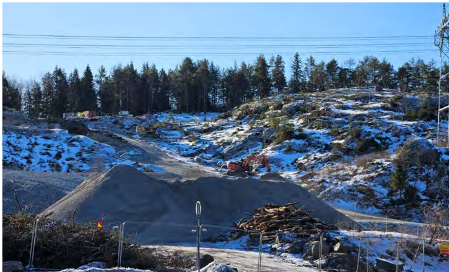
Anleggsarbeidet opp til Liåsen transformatorstasjon er i gang.