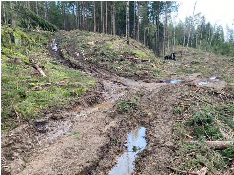
Slik så det ut etter at milliardkonsernet OBOS hadde hugget skogen sin.

et stort potensial for å utvikle en større artsriktighet, med allerede noen vindfall og læger. Vi besluttet derfor å klage på vedtaket om å tillate hogst her, og vi ba om at klagen ble gitt oppsettende virkning.