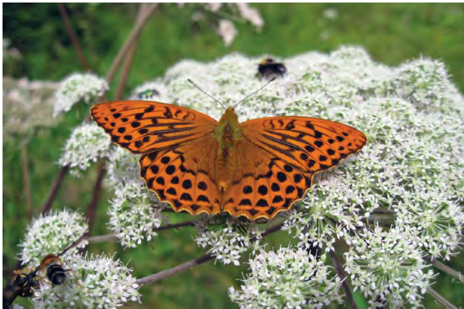
Keiserkåpen er del av naturmangfoldet vi må ta bedre vare på – den kan du møte i Østmarka.