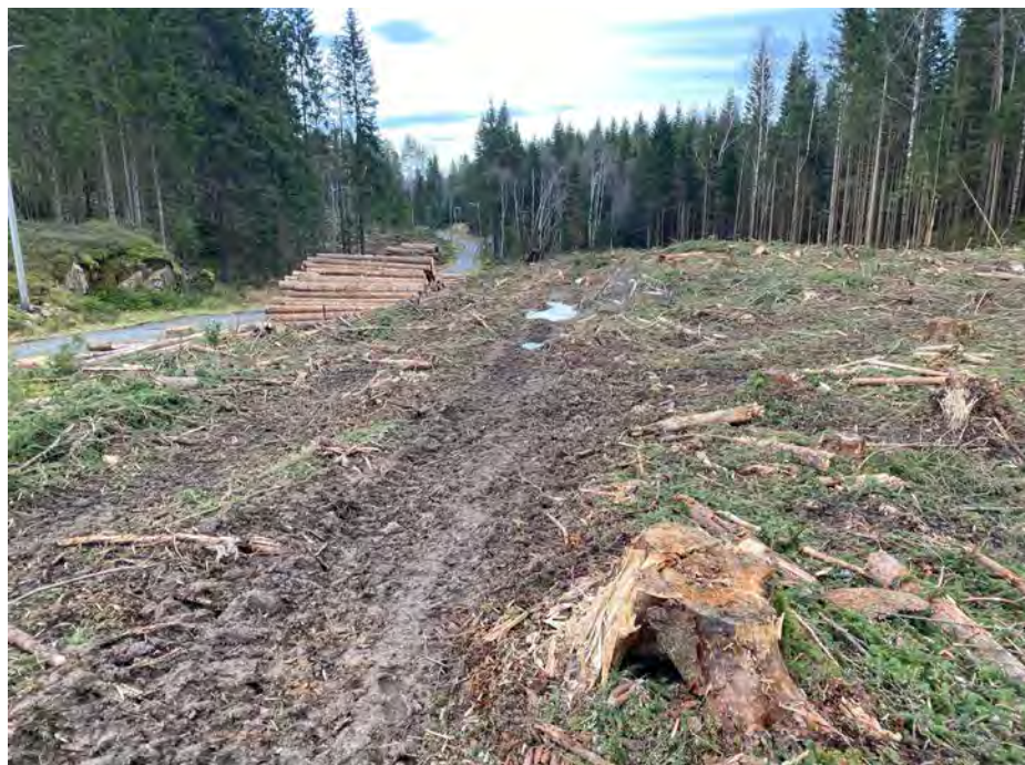
En av flatehogstene til Søndre Hauger, gjennomført én uke før klagefristen gikk ut.

konsekvenser for friluftslivet. Blant annet skal det flatehogges 22 dekar i og tett inntil den svært mye brukte blåmerkete stien langs østsiden av fri-Elvåga. Dessuten har landbrukskontoret stilt som betingelse at det ikke tillates vinterdrift på arealene som sogner til Mariholtløypa. Konsekvensene av det kunne vi se allerede én uke før klagefristen gikk ut; da var en av hogstene gjennomført(!), med store kjøreskader som resultat. Samtidig hadde det også blitt hogd i Obos-skogen vis-a-vis, og der så det ut som en slagmark (dette er nærmere omtalt under).