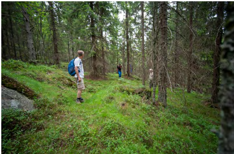
Losby Bruk har søkt om å bygge en svær skogsvei i dette nærmest uberørte området øst for Elvåga.

ØV gjorde Dammyrveien til tema i kommunevalget høsten 2023. Organisasjonen spurte de politiske partiene i Lørenskog om deres mening i saken, og da viste det seg at fem partier – Miljøpartiet de Grønne (MDG), Sosialistisk Venstreparti (SV), Rødt, Venstre (V) og Kristelig Folkeparti (KrF) – allerede hadde bestemt seg for å stemme imot veibyggingen. Arbeiderpartiet (Ap) og Høyre (H) ville ikke ta standpunkt før kommunens administrasjon hadde lagd en saksutredning til den kommende politiske behandlingen.