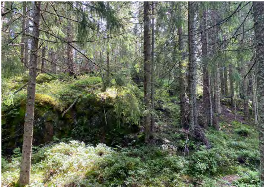
Et parti fra nærskogen mellom Blystadlia og Bjønnåsen før hogsten gjennomføres.

de hadde jo stilt krav om at «Eventuelle sjenerende kjøreskader og hogstavfall på sti og vei skal rettes/fjernes snarest mulig etter hogst». Men det sto ikke noe om kjøreskader og avfall utenfor stiene.