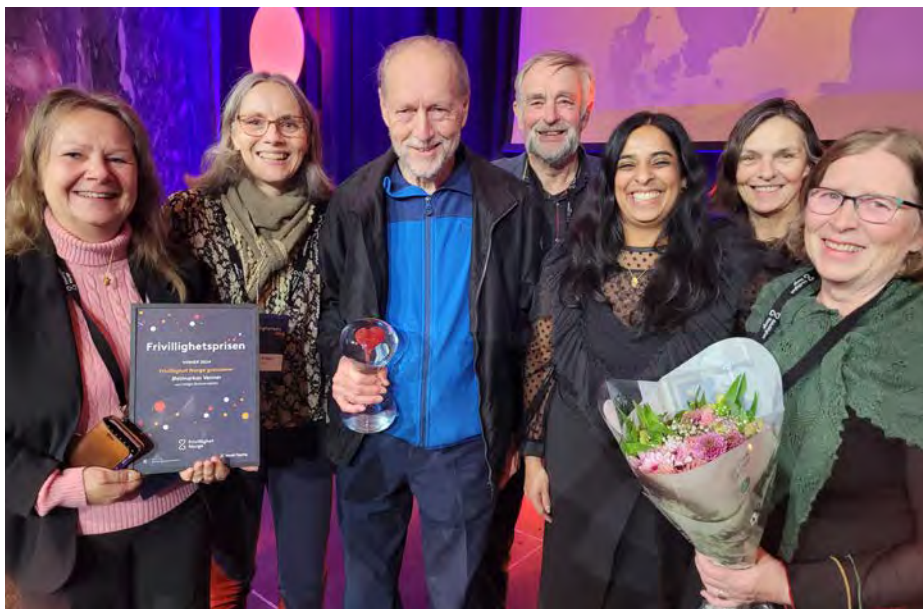
Gjengen i Østmarkas Venner under utdeling av Frivillighetsprisen sammen med kultur- og likestillingsminister Lubna Jaffery.