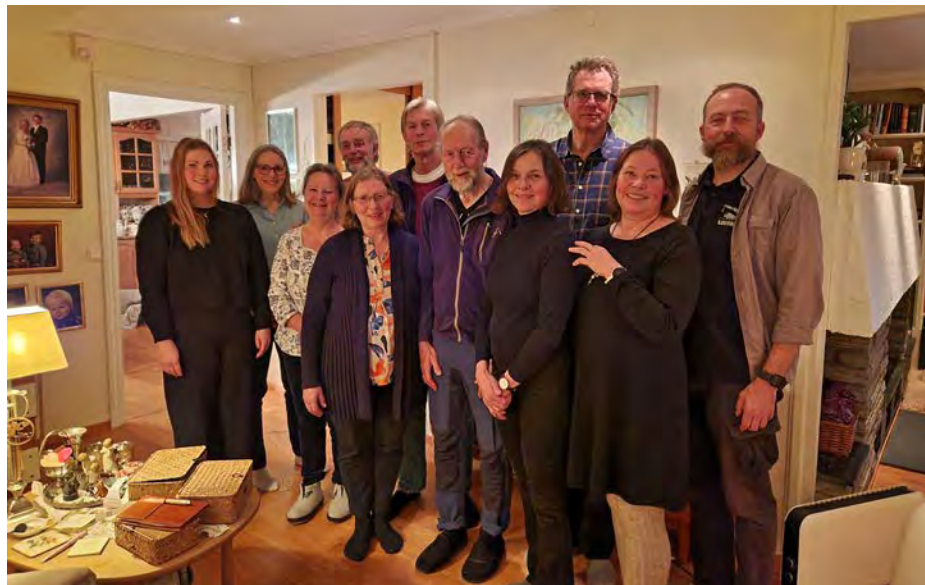
Styret i Østmarkas Venner sammen med administrativ leder i desember 2024.