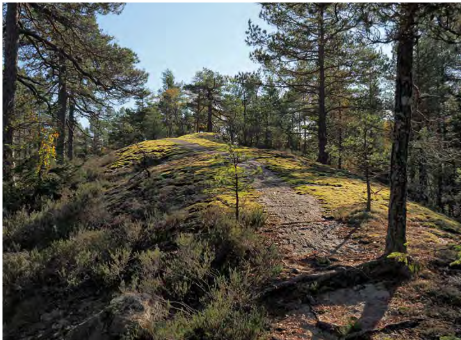
Den vakre stien over Kristenseteråsen ble blåmerket for noen år siden og går over en serie med særpregede, tørre og mosegrodde rygger.

I september vedtok kommunestyret i Enebakk med stort flertall å tilby deler av kommuneskogen som frivillig vern. Det gjelder områdene Kristenseteråsen, Melketangene og Vikholåsen på til sammen 1633 dekar.