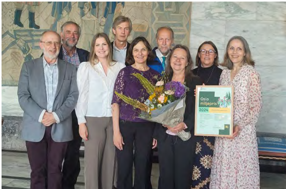
Østmarkas Venner ble hedret med Oslo kommunes miljøpris.