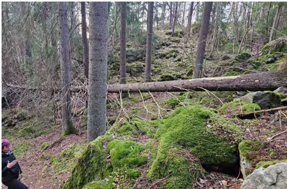
Her foreslo BYM å utrede en turvei, det er nå lagt på is etter innspill fra ØV.

skal påvirke vannmiljøet i Ljanselva negativt. Dette må vies større oppmerksomhet i konsekvensutredningen.