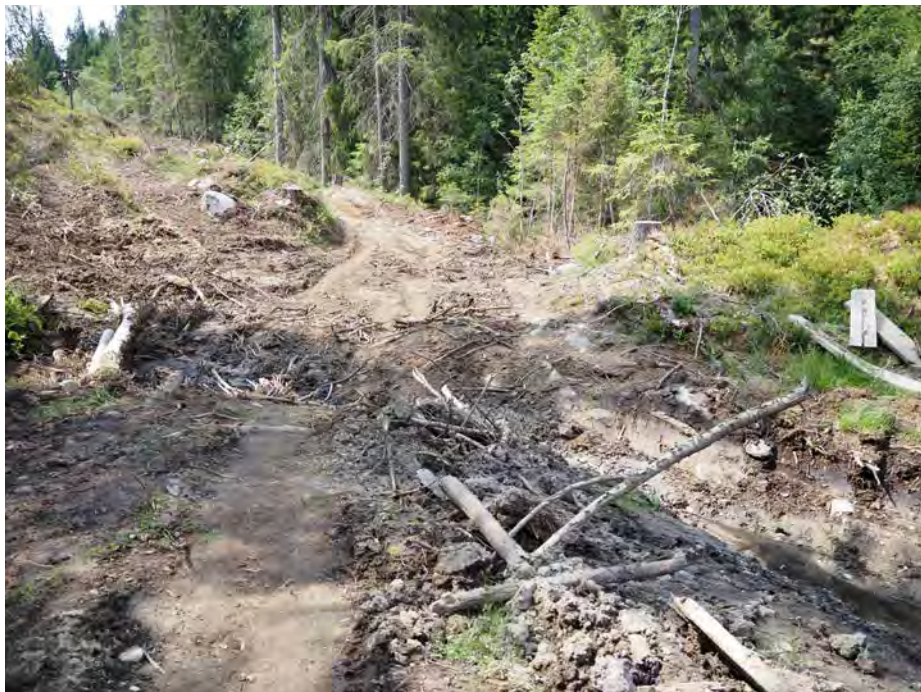
Slik så det ut i Brudalen i juli 2023.

Vi observerte at det er behov for å styrke bæreevnen, og at byggingen av den nye veien i utgangspunktet ikke burde innebære vesentlige inngrep. Men ifølge planene skulle det utføres omfattende sprengningsarbeider for å få masser til bærelaget. Dette ville i så fall resultere i flere høye fjellskjæringer og at en kolle ble utradert. Dessuten var det planlagt flere snu-, møte- og velteplasser som ville kreve mye areal.