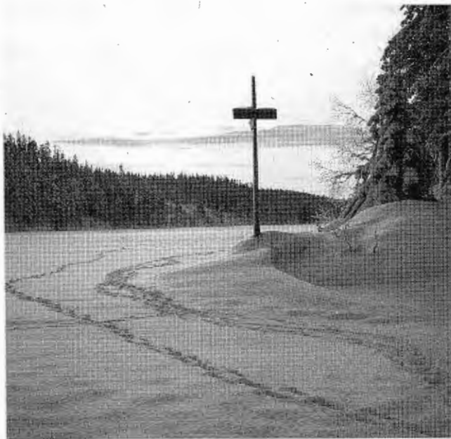
Nordbysjøen, Østmarka.

Når turen først er lagt til disse kanter av marka, er variasjonsmulighetene mange. Du kan godt ta løypa ned til Marikollen igjen, men også fortsette enda lenger nordover mot Aamodtdammen og komme ned til Kurland, Løvenstad og Blystadlia. Herfra går det løype over Rælingsåsen tilbake