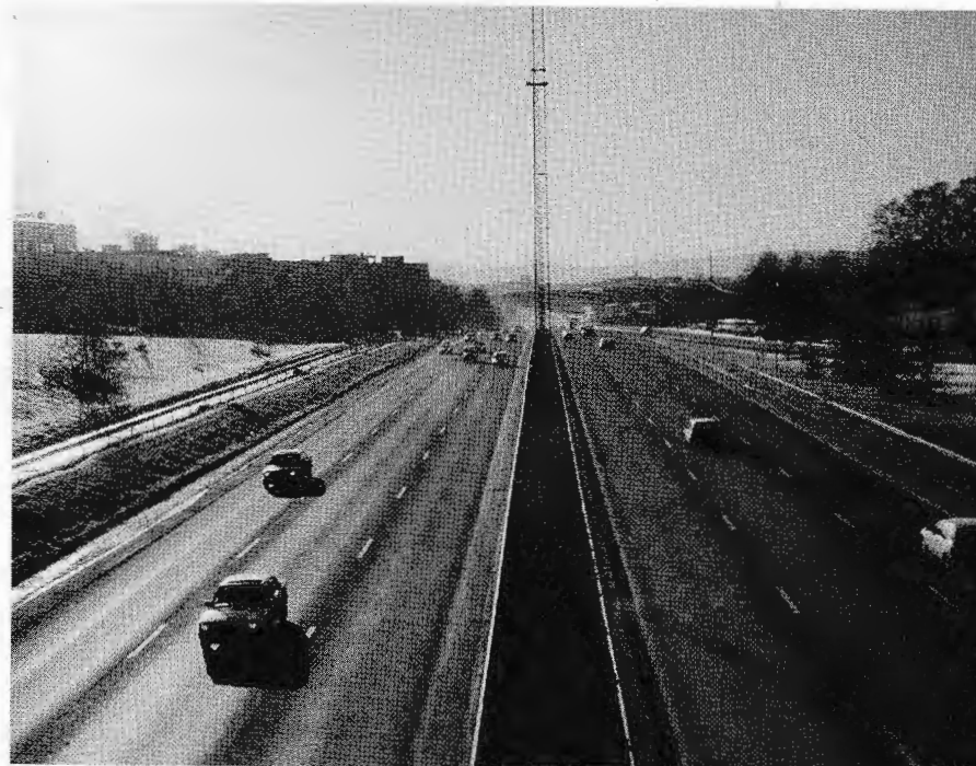
E6 ved Furuset. Vi trenger Østmarka til å puste i!

Allerede i månedsskiftet januar/februar 1998 burde ledelsen i NSB Gardermobanen AS og den politiske og administrative ledelsen i Samferdselsdepartementet ha innsett at en ikke ville klare å åpne Romeriksporten den 8. oktober. I stedet endret de tettestrategi, på tvers av faglige anbefalinger, for å rekke åpningsdatoen. Hvor mye denne feilvurderingen har kostet samfunnet er det ingen som har beregnet. Det er sterkt beklagelig at Mydske-rapporten ikke vier denne delen av tetteprosessen nok oppmerksomhet. Ved siden av manglende tetting i hele 1997 er denne fasen den meste kritikverdige når det gjelder tettingen av Romeriksporten.