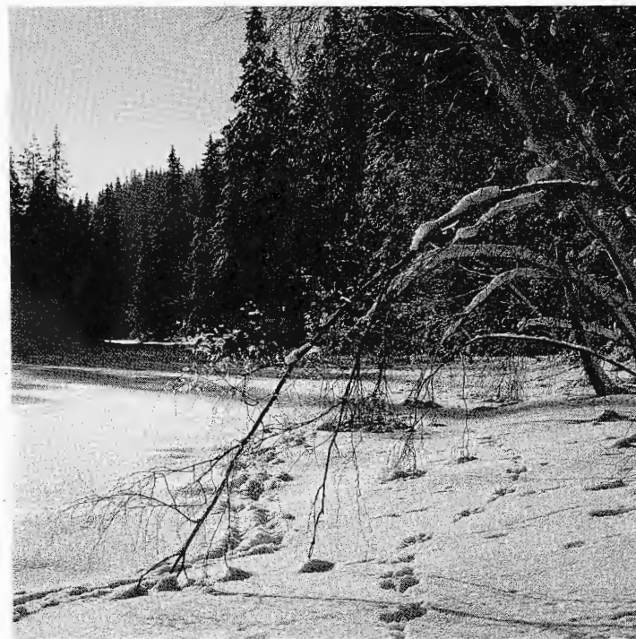
Sporsnø på S. Krok vann, Østmarka

I 1993 gjennomførte Oslo kommune en brukerundersøkelse av Marka. Den viste at for 70 prosent av brukerne var målet å oppleve ro og stillhet. Dette vil uten tvil fortsatt være det viktigste formålet, men også andre aspekter ved naturopplevelse vil få økt betydning,