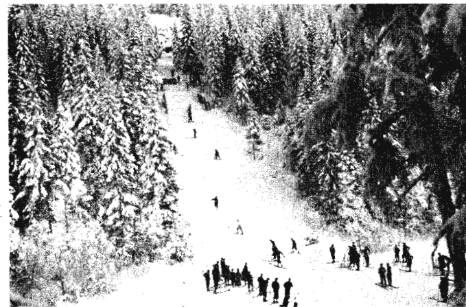
«Speed»-bakken tatt i bruk i 1931. (Foto fra boka «Speed gjennom 50 år»)

Noen kilometer lengre syd i Marka finner vi neste bakke. Vi følger veien fra Grønmo, passerer Sølvdobla, dreier til høyre inn blåmerket sti i retning Døle- rud. Etter 500 meter ser vi en stein- haug på venstre side av stien. Her hadde Klemetsrud IL sin hoppbakke, Døle- rudbakken. Hoppet var høyt oppe til